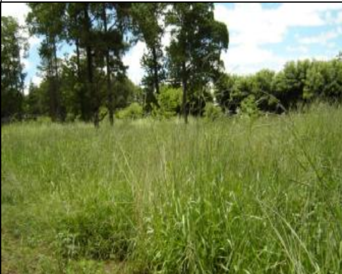
Melhoramento de pastos naturais por cultivo

A segunda modalidade é abrir faixas paralelas a todo o comprimento da área, com larguras de 5 metros e distanciadas de 5 em 5 metros. Nas faixas lavradas, semear pastos com o mesmo procedimento no melhoramento por cultivo.