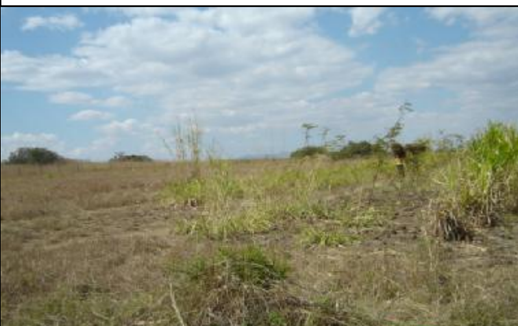
Melhoramento dos pastos naturais por reforço

Devido às queimadas descontroladas que acontecem anualmente, destroem o banco de sementes, resultando em fraca produção, dando oportunidade a invasão arbustiva. Uma utilização por animais anualmente, sem possibilidades de rotação, influi também na baixa produtividade. Em Moçambique, o encabeçamento é de 5 hectares como médio para uma unidade animal com o peso médio de 250 kg . A introdução das culturas de rendimento e, a melhoria dos preços de alguns produtos agrí-