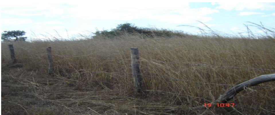
Pasto de Hyparrhenia sp em maturação