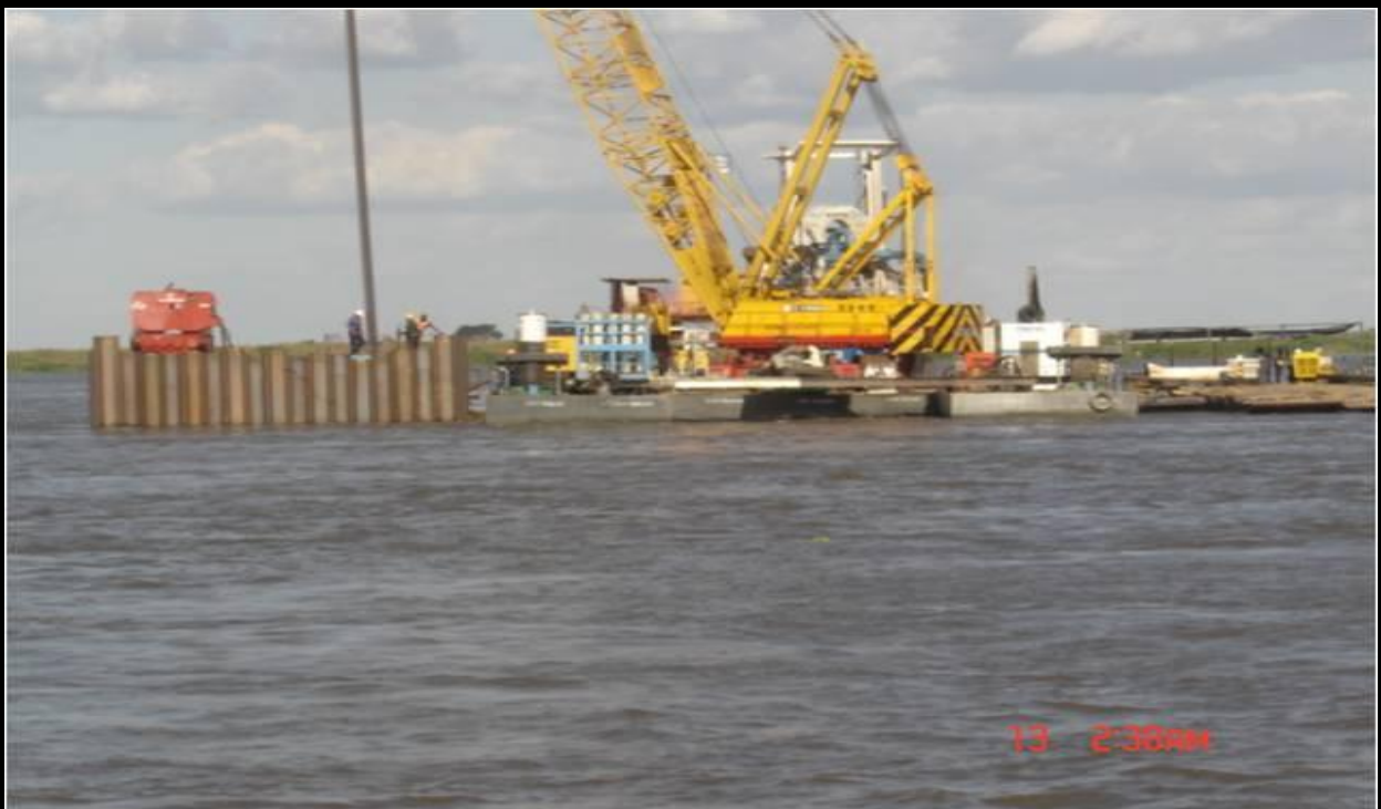
Imagem ilustrando os trabalhos da construção de estacas no rio