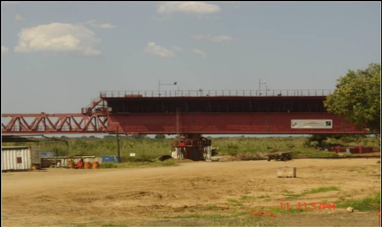
Imagem ilustrando as armaduras para a construção do tabuleiro