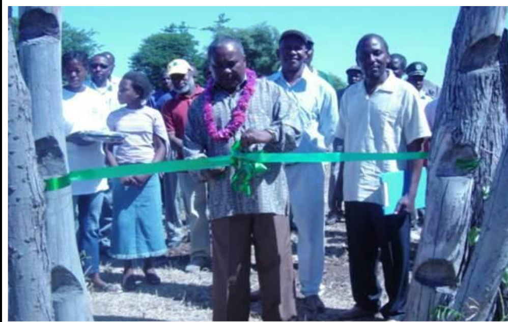
Momento do corte da fita, acto formal da inauguração