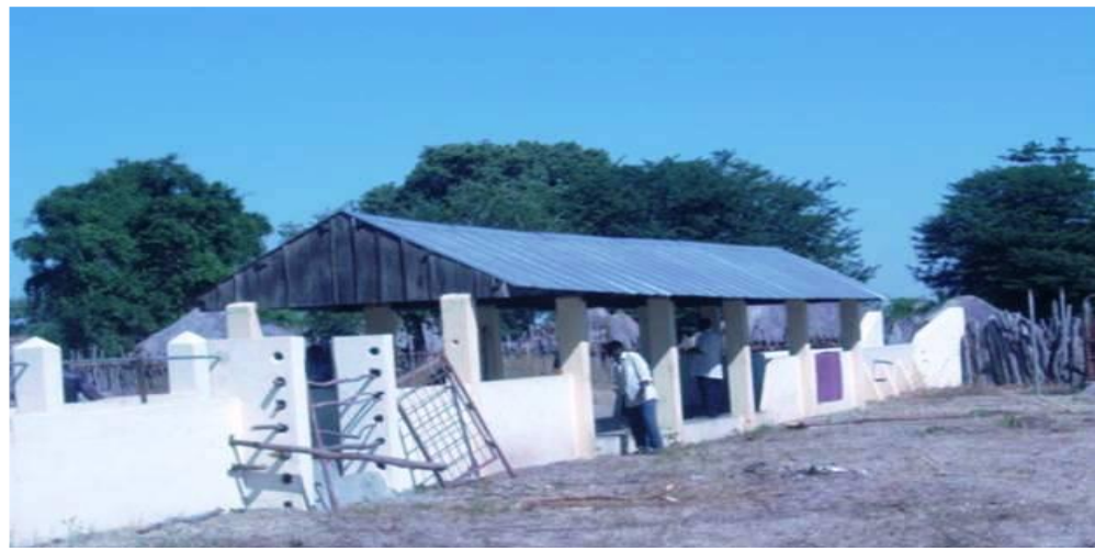
TANQUE CARRACICIDA ora inaugurado em Mucumbura