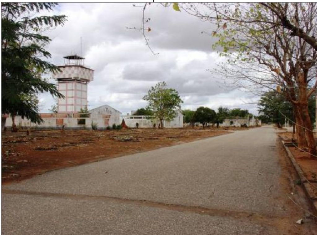
Vista parcial da Escola profissional de Chingodzi - Tete

Destas todas acções, mereceu prioridade o de formação no Centro de Chingodzi, embora esteja também a ser envidados esforços no sentido de arrancar com os projectos pecuário de Chitima, o refloresta-