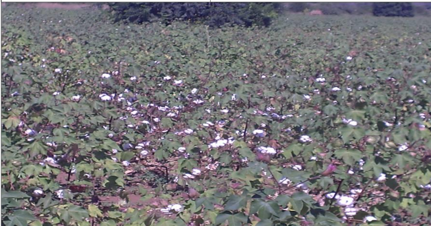
Campo de algodão em Chingodzi - Tete

Mas as actividades da Escola não param por aí. No âmbito de Escola e aprendizagem técnica, podem ser vistas nos campos de Chingodzi campos de hortícolas diversas, fruteiras, repolho, alface, cenoura, entre outros, para além de criação de galinhas e cabritos.