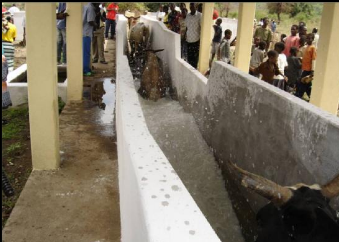
O gado de M'phandzu num banho carracida de ensaio depois de cinco anos da paralização do tanque