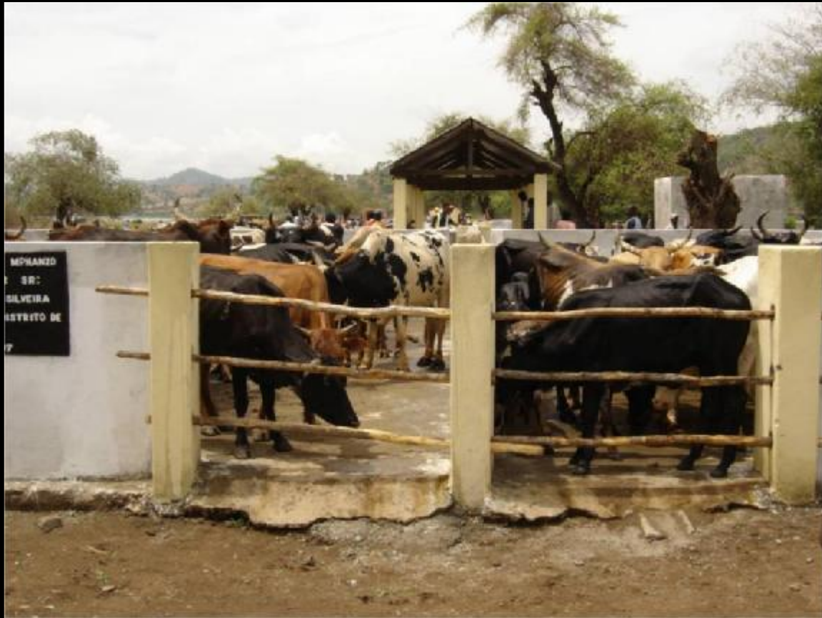
Gado bovino de M'phandzu depois do bando carracida

DESEJAMOS A TODOS FESTAS FELIZES E UM PRÓSPERO ANO NOVO.